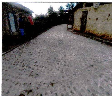
Foto 04: Execução de pavimentação na rua projetada 01 no Bairro Alto do Paraíso.