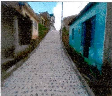
Foto 11: Pavimentação executada na rua projetada 01 – Freitas próximo a igreja.