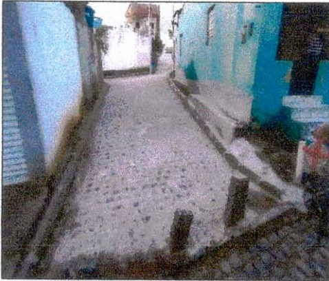
Foto 07: Pavimentação na rua projetada 02 no Bairro Alto do Paraíso.