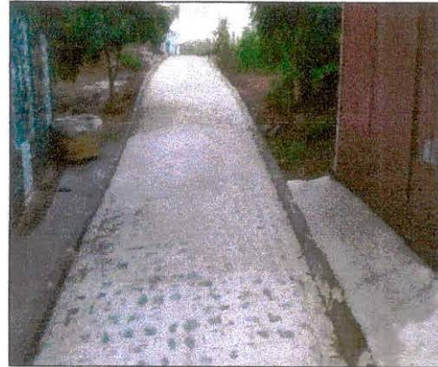
Foto 08: Pavimentação na rua projetada 02 no Bairro Alto do Paraíso.