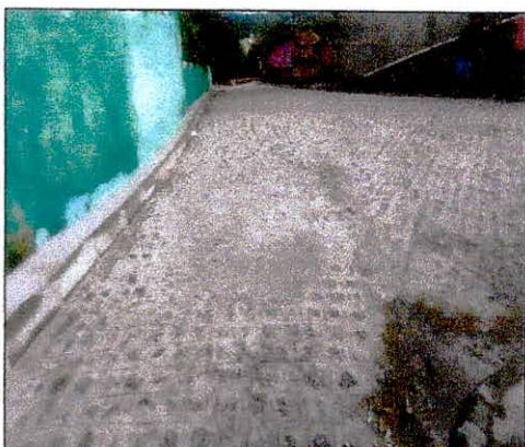
Foto 05: Execução de pavimentação na rua projetada 01 no Bairro Alto do Paraíso.