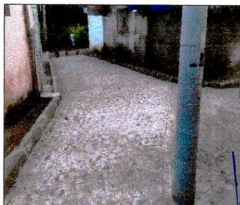
Foto 06: Pavimentação na rua projetada 02 no Bairro Alto do Paraíso.

Augusto Cesar de F. Soares Eng. Civil - CREA 24180-D/PE Fone: (81) 3628-0597