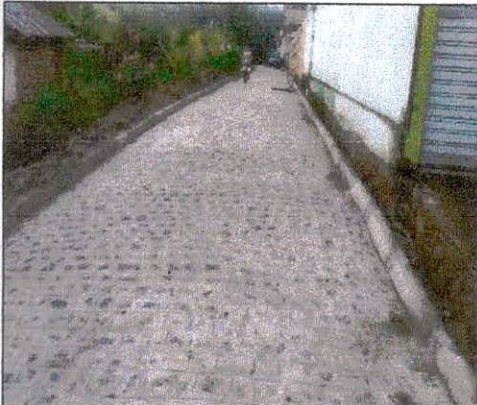
Foto 09: Pavimentação executada na rua projetada 01 – Freitas próximo a igreja