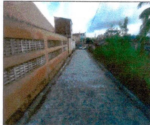
Foto 10: Pavimentação executada na rua projetada 01 – Freitas próximo a igreja.