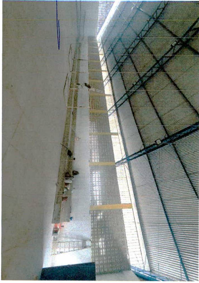
Relatório fotográfico - Medição 003

Inês Groy Cavalante Branger Eng.º Civil RNP 1.003425187