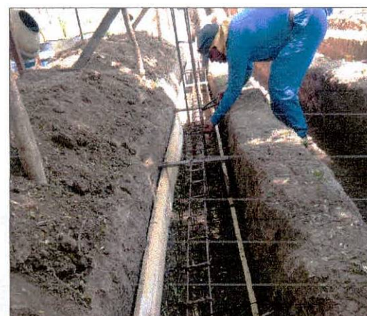
Foto 12: Execução de elementos estruturais, colocação das armações.

Breno Hugo B. Inocêncio Engenheiro Civil CREA 38.291 D/PE