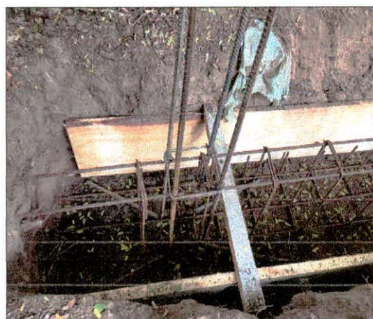
Foto 11: Execução de elementos estruturais, colocação das armações.